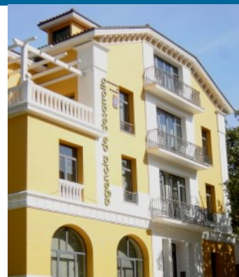
Villaflores. C/Magallanes, 30 39007 Santander Tel: 942 20 30 30