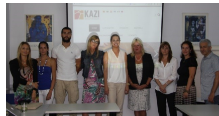
Reunión transnacional de socios en Atenas

Santander, única ciudad española en el ranking de las 50 ciudades inteligentes del mundo de National Geographic