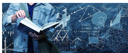
Ayudas Cheques de Innovación para el año 2019