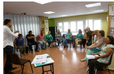
Participantes en uno de los Proyectos Integrados de Empleo