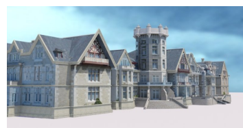
Infografía del Palacio de la Magdalena

Está previsto que todos los proyectos se cuelguen en diferentes webs municipales, con el fin de que las personas interesadas puedan realizar visitas virtuales por los edificios más representativos de la ciudad.