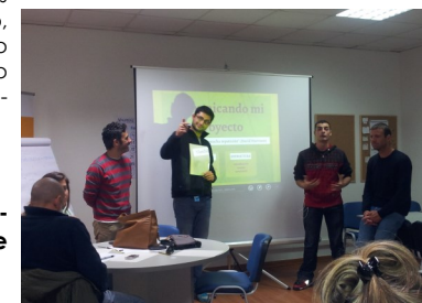
Alumnos del Taller de Empleo "Santander Ecológica"