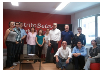
Integrantes de la II Lanzadera de Empleo de visita en el espacio de coworking Distrito Beta

Otra iniciativa interesante que se pondrá en marcha durante el mes de noviembre es un ciclo de cine solidario, con una entrada simbólica, recaudación que se destinara fines sociales.